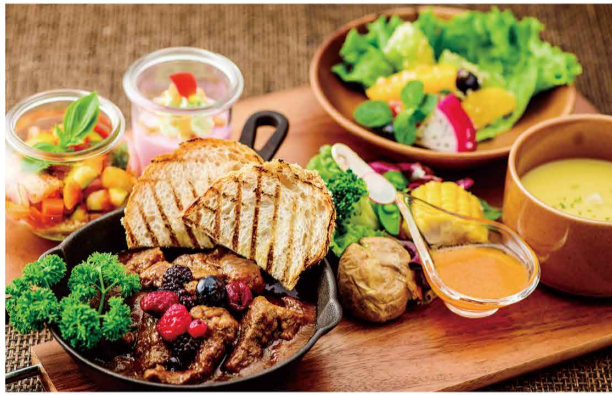
Plate (スープ・デザート付) (Includes Soup & Dessert)

赤いフルーツを使ったビーフシチュープレート Red Berry Beef Stew Plate 紅色系水果燉牛肉 附湯・甜點 적색 과일로 만든 비프스튜 정식 스프・디저트 포함