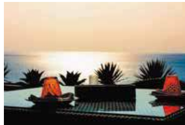
Wine&Dining The Orange [Hotel 1F] ☎098-964-7711 <Breakfast>6:30-10:00 / L.O. 9:30 <Lunch> 11:30 - 15:00 / L.O. 14:30 <Dinner>18:00 - 23:00 / L.O. 22:00 *Course L.O. 21:00