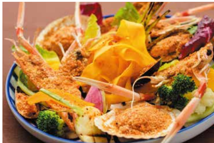
Three types of Seafood with Diabolic Pumpkin Salad 三色海鮮之惡魔風味南瓜沙拉 어패류 3종과 디아블로풍 단호박 샐러드 ¥3,600 *Limited offer : 10/1~10/31