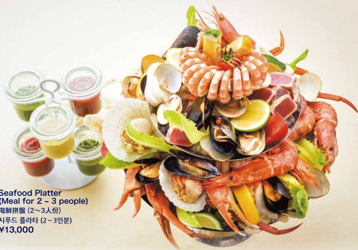
Seafood Platter (Meal for 2 ~ 3 people) 海鮮拼盤 (2~3人份) 시푸드 플라타 (2~3인분) ¥13,000