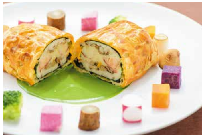
Omar Lobster/ Fresh Fish and Scallop Mousse En Croûte/ Crown Daisy scented White Wine Sauce 螯蝦 近海鮮魚與干貝慕斯之烤派 佐 茼蒿白葡萄酒醬汁 랍스타 생선과 가리비 조개 무스의 앙쿠르트 속갓향 반플란 소스 ¥4,000