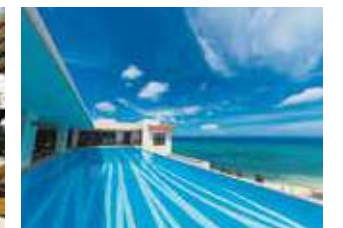
Annex 12F Pool