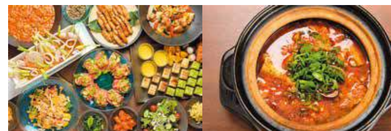
Choose your Main Dish, Semi Lunch Buffet 可任選主菜之Blue自助午餐 메인 요리를 선택하는 Blue 런치 뷔페 Lunch ¥1,500~