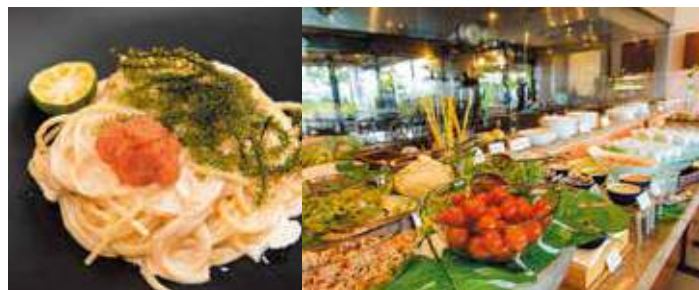
Choose your Main Dish, Semi Lunch Buffet 主菜+自助餐點 메인 요리 + 세미 뷔페 Lunch ¥1,680~