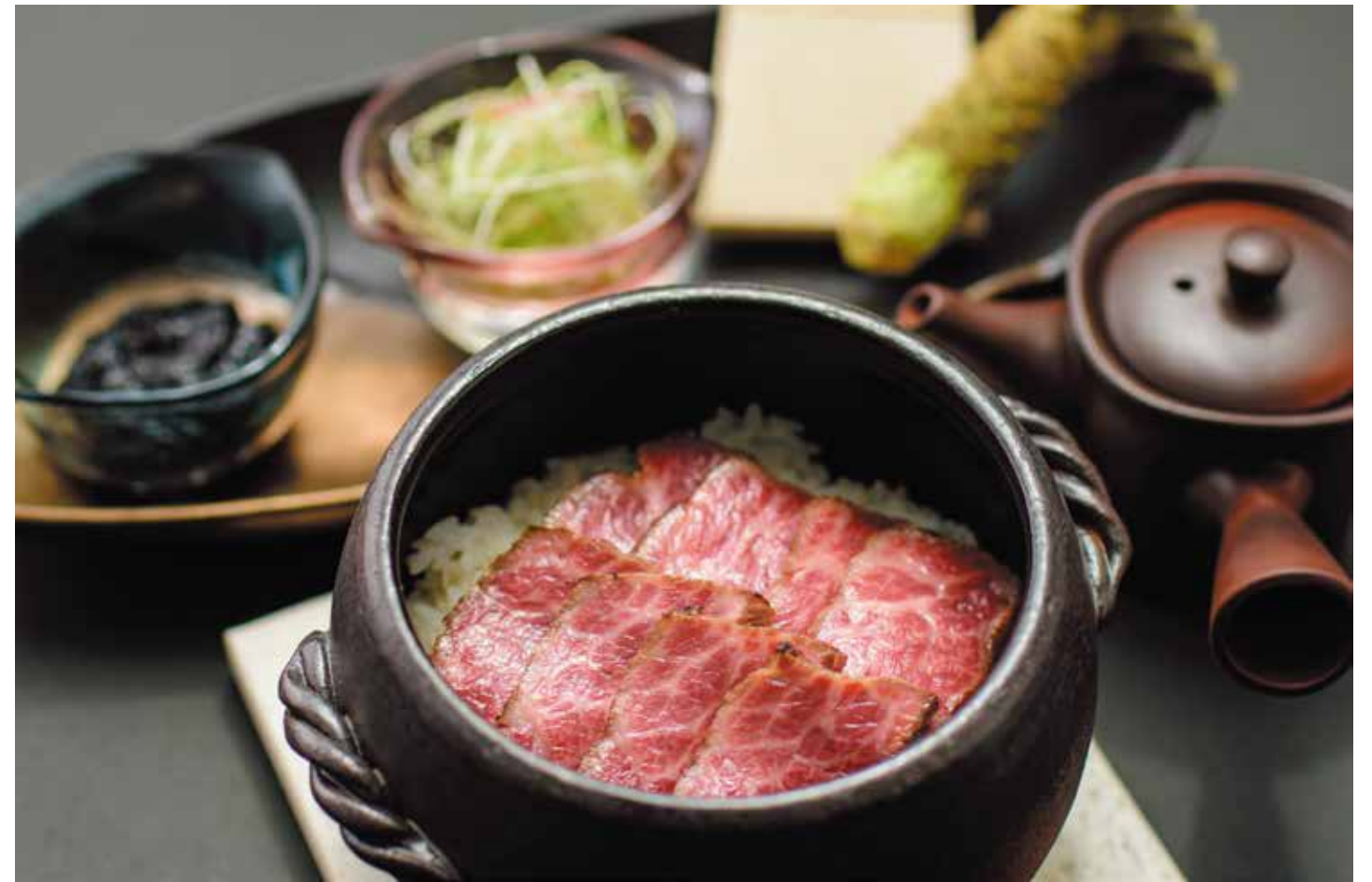
Soy sauce marinated Okinawan Beef cooked over charcoal 沖繩縣產牛之香味桶蓋飯 오키나와산 소고기 히쓰마부시 덮밥 ¥3,400