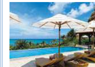
Hotel 2F Pool

April - October ▶ 8:30 - Closes @ sunset November - March ▶ Closed *Both swimming pools are available for all our guests staying at any tower. *Things such as water tubes (floats) and beach balls are prohibited at the swimming pool on the 12th floor of Annex Tower for safety reasons. (Water wings for children are acceptable) *There is no changing room on the 12th floor of Annex Tower.