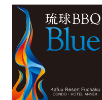
Ryukyu BBQ Blue [Annex 12F] ☎098-963-0755 <Breakfast>6:30-10:00 / L.O. 9:30 <Lunch> 11:30 - 15:00 / L.O. 14:30 <Dinner>18:00 - 23:00 / L.O. 22:00 *Course L.O. 21:00