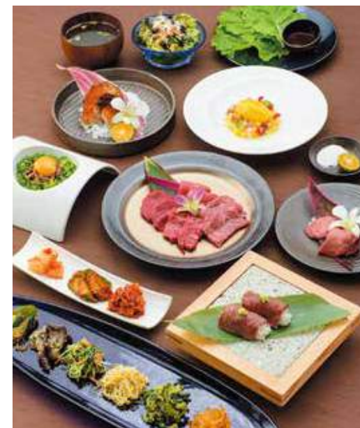
Bottom Flap Meat marinated with Coconut Green Curry 椰奶綠咖喱醬牛肉 코코넛 그린카레 양념에 재운 갈비살 ¥2,600