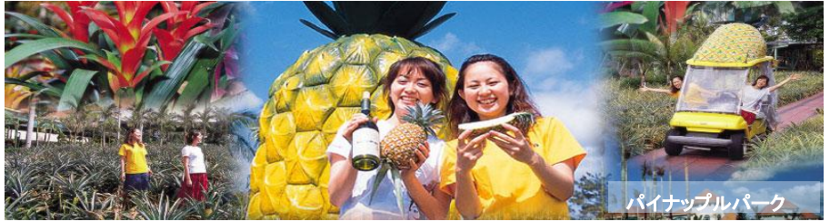
パイナップルパーク