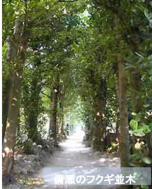
備瀬のフクギ並木