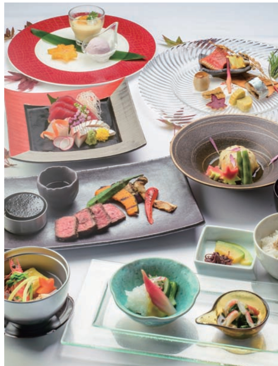
MUKU COURSE 无垢套餐 無垢套餐 무쿠 코스 ¥10,000

Amuse, Japanese Clear Soup, Sashimi, Stew Grilled seasonal delicacies, Main: Stone-baked Okinawa wagyu beef, with Japanese vegetable sauce Rice, Sweets 前菜2種、日式湯、生魚片冷盆、炖菜、燒烤拼盆 主菜 石烤本部牛(县产黑毛和牛)沙朗 日本蔬菜醬 膳食、甜點 前菜2種、日式湯、生魚片冷盆、燉菜、燒烤拼盆 主菜 石烤本部牛(縣產黑毛和牛)沙朗 日本蔬菜醬 膳食、甜點 전채요리, 국물요리, 생선회, 조림요리, 구이요리 고기요리 오키나와 모토부산 소고기의 돌판 로스구이 야채소스 식사, 디저트