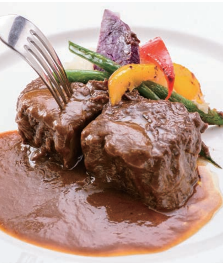
Okinawa beef ragout in red wine 红酒炖县产和牛 紅酒燉縣產和牛 오키나와산 소고기의 레드와인 조림