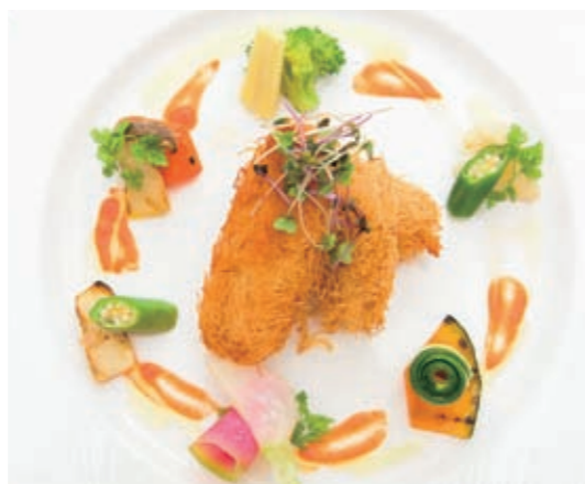
Red sunfish kadaif pie 香烤细面裹红翻车鱼 香烤細麵裹紅翻車魚 개복치 카다이프 말이 튀김 ¥2,200