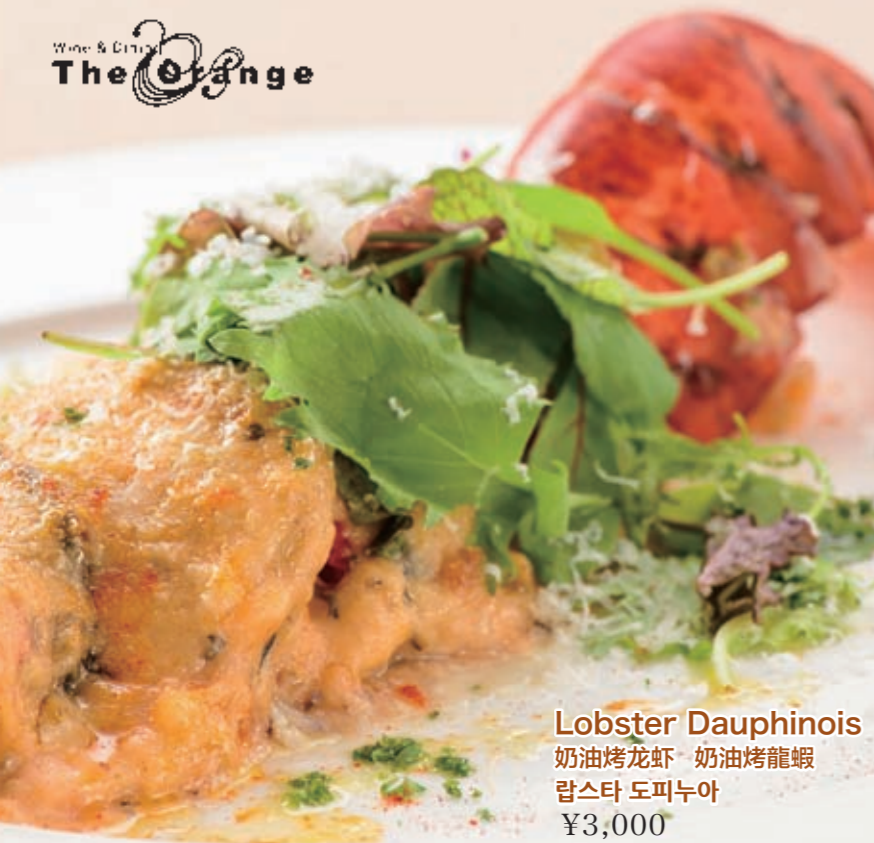
Lobster Dauphinois 奶油烤龙虾 奶油烤龍蝦 랍스타 도피누아 ¥3,000

Wine&Dining The Orange [1F] ☎098-964-7711 <Breakfast>6:30-10:00 / L.O. 9:30 <Lunch> 11:30 - 15:00 / L.O. 14:30 <Dinner>18:00 - 23:00 / L.O. 22:00 *Course L.O. 21:00