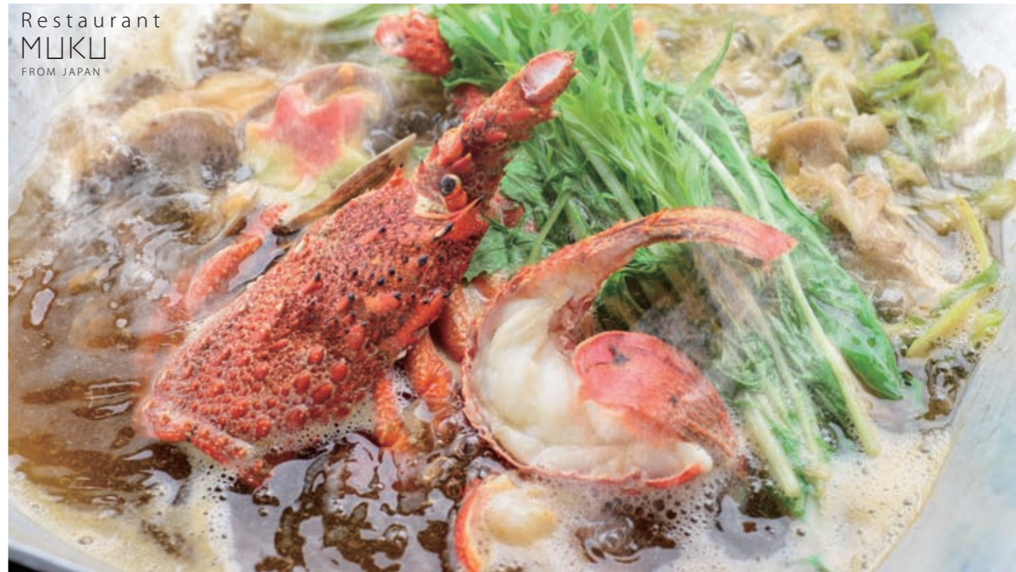
"ISE" Lobster Sea food Pot 伊勢龙虾海鮮鍋 伊勢龍蝦海鮮鍋 랍스타 해물탕 ¥4,500