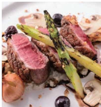
Roasted Okinawa duck with berry sauce 莓酱伊江岛烤鸭 莓醬伊江島烤鴨 오키나와 이에산 로스트 오리고기 베리소스 ¥2,900