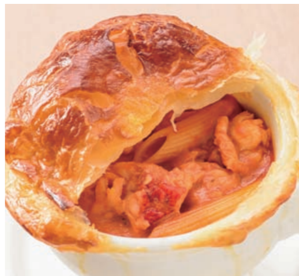
A pot pie containing lobster and creamy tomato pasta. 烤龙虾奶油番茄意大利面派 烤龍蝦奶油番茄義大利麵派 랍스타 토마토 크림 파스타 포트파이 스타일 ¥2,200

Wine&Dining The Orange [1F] ☎098-964-7711 <Breakfast>6:30-10:00 / L.O. 9:30 <Lunch> 11:30 - 15:00 / L.O. 14:30 <Dinner>18:00 - 23:00 / L.O. 22:00 *Course L.O. 21:00