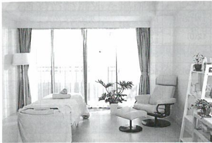
完全個室でプライバシーを保つリラックス空間

2013年7月に完全リニューアルオープンした「サザンビーチホテル&リゾート」の沖縄の素材を生かしたエステサロン「アズールスパ」はテナントにて09年5月20日開業。